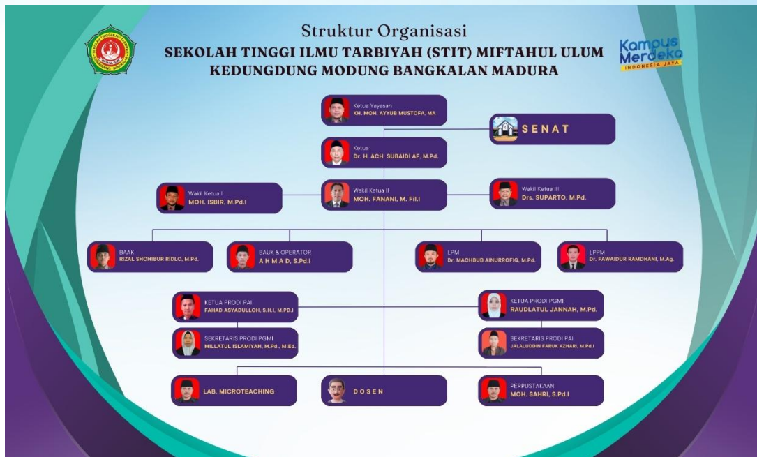
Gambar C.1. Struktur Organisasi STITMUBA

Struktur Organisasi STIT Miftahul Ulum Bangkalan Kedungdung Modung Bangkalan Madura digambarkan sebagai berikut: