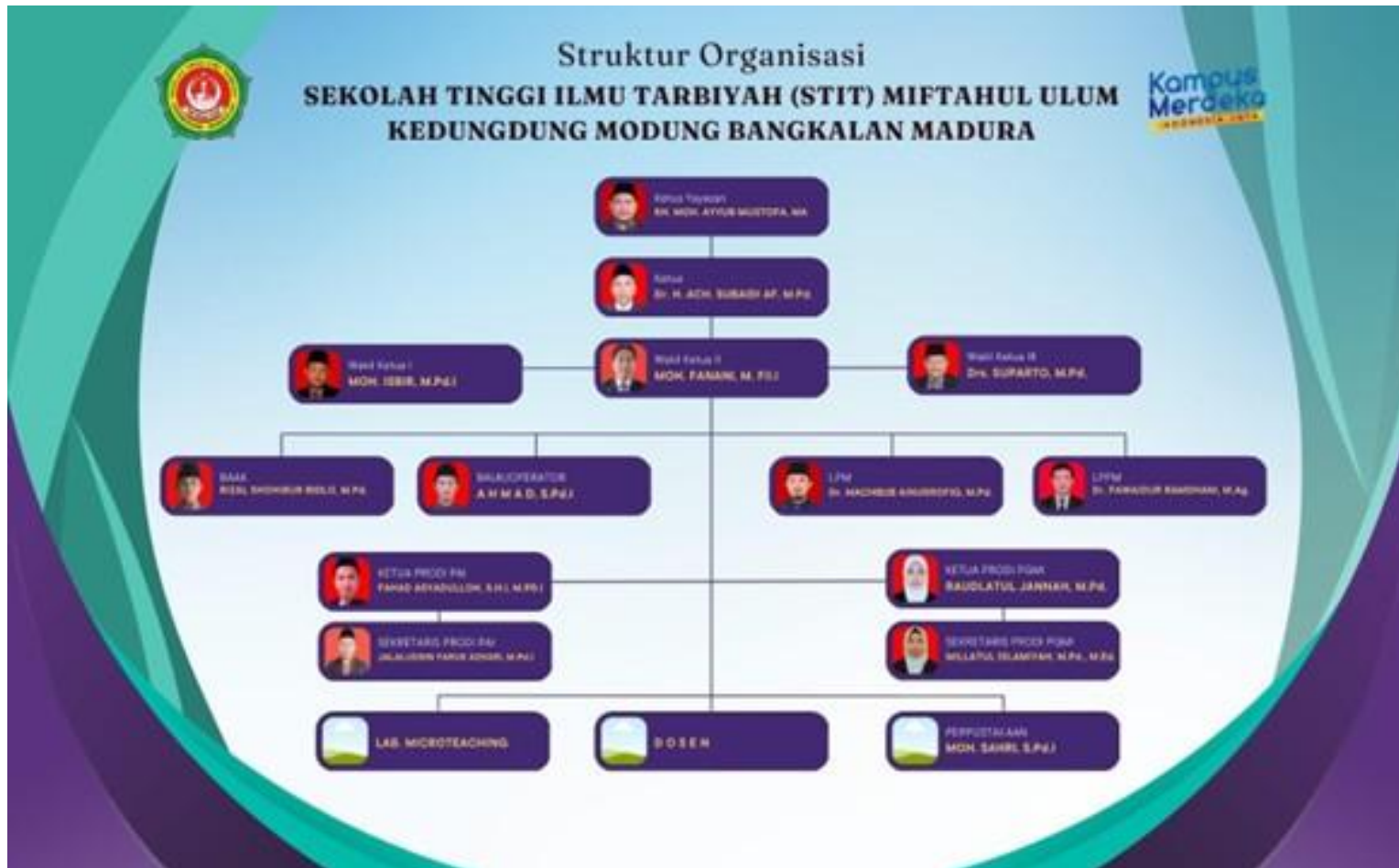
Gambar 1. Struktur Organisasi STIT Miftahul Ulum Bangkalan